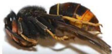
Gyne FA en dormance pendant la phase hivernale